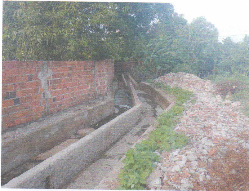
FIGURA 3 – SERVIÇO DE DEMOLIÇÃO E LIMPEZA – TRECHO ENTRE A RN – 177 E RUA PROFESSORA DALILA DA FONSECA ROCHA;