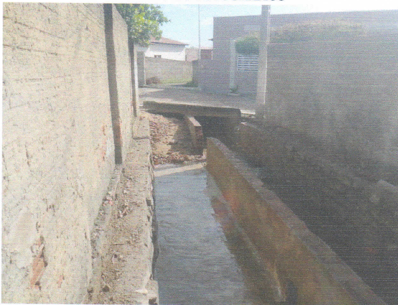
FIGURA 9 – SERVIÇO DE DEMOLIÇÃO E LIMPEZA – TRECHO ENTRE A RUA 15 DE NOVEMBRO E RUA 7 DE SETEMBRO;