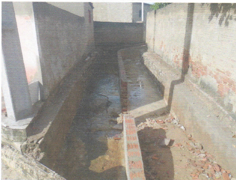
FIGURA 11 – SERVIÇO DE DEMOLIÇÃO E LIMPEZA – TRECHO ENTRE A RUA 7 DE SETEMBRO E RUA DELFINO DE OLIVEIRA;