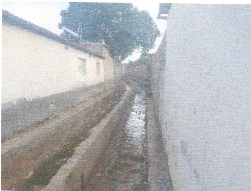
FIGURA 5 – SERVIÇO DE DEMOLIÇÃO E LIMPEZA – TRECHO ENTRE A RUA PROFESSORA DALILA DA FONSECA ROCHA E RUA 15 DE NOVEMBRO;