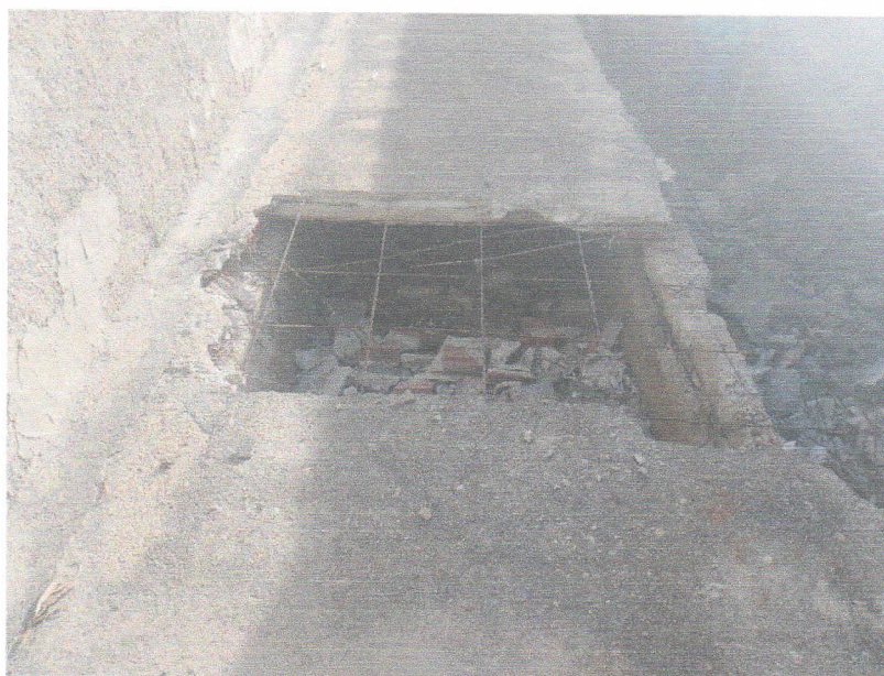
FIGURA 6 - SERVIÇO DE DEMOLIÇÃO E LIMPEZA – TRECHO ENTRE A RUA PROFESSORA DALILA DA FONSECA ROCHA E RUA 15 DE NOVEMBRO;