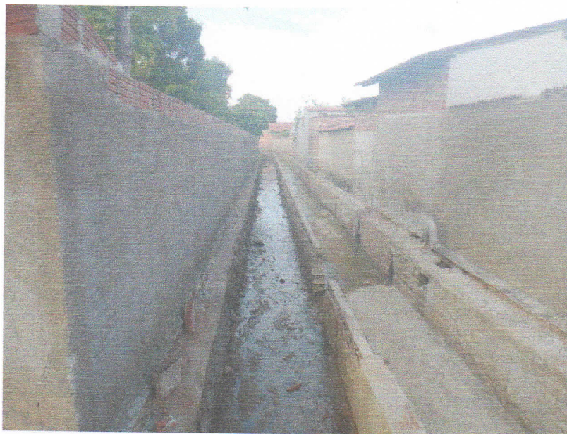
FIGURA 4 - SERVIÇO DE DEMOLIÇÃO E LIMPEZA – TRECHO ENTRE A RUA PROFESSORA DALILA DA FONSECA ROCHA E RUA 15 DE NOVEMBRO;