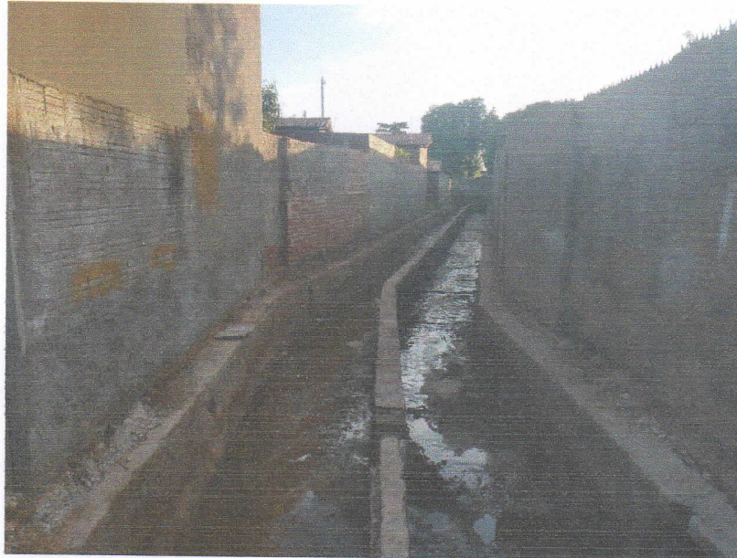
FIGURA 7 – SERVIÇO DE DEMOLIÇÃO E LIMPEZA – TRECHO ENTRE A RUA PROFESSORA DALILA DA FONSECA ROCHA E RUA 15 DE NOVEMBRO;