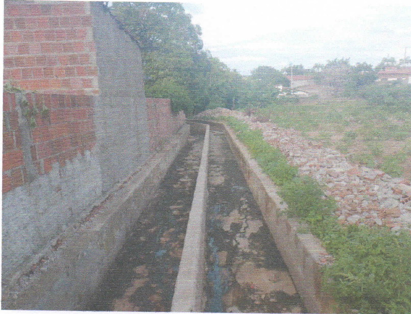
FIGURA 1 – SERVIÇO DE DEMOLIÇÃO E LIMPEZA – TRECHO ENTRE A RN – 177 E RUA PROFESSORA DALILA DA FONSECA ROCHA;