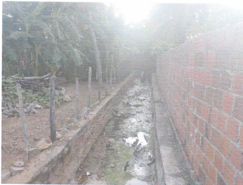
FIGURA 2 - SERVIÇO DE DEMOLIÇÃO E LIMPEZA – TRECHO ENTRE A RN – 177 E RUA PROFESSORA DALILA DA FONSECA ROCHA;