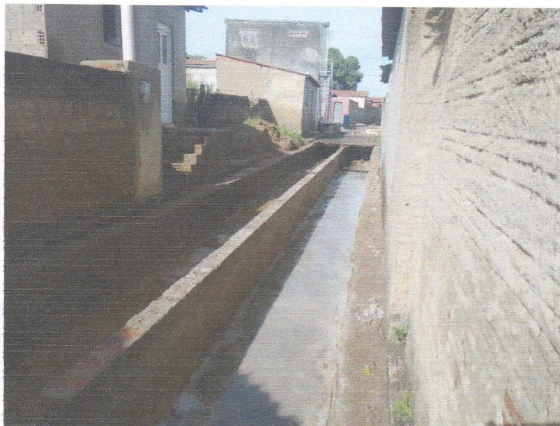
FIGURA 10 - SERVIÇO DE DEMOLIÇÃO E LIMPEZA – TRECHO ENTRE A RUA 15 DE NOVEMBRO E RUA 7 DE SETEMBRO;