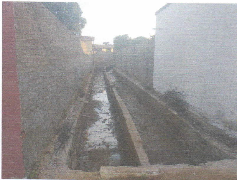
FIGURA 8 - SERVIÇO DE DEMOLIÇÃO E LIMPEZA – TRECHO ENTRE A RUA PROFESSORA DALILA DA FONSECA ROCHA E RUA 15 DE NOVEMBRO;