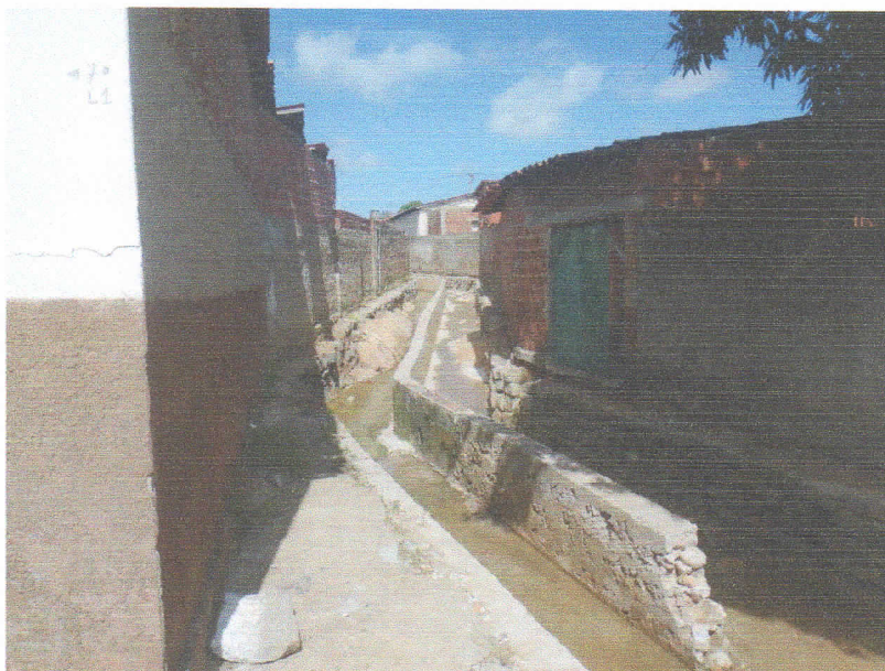
FIGURA 12 - SERVIÇO DE DEMOLIÇÃO E LIMPEZA – TRECHO ENTRE A RUA DELFINO DE OLIVEIRA E RUA BEVENUTO ALVES DA ROCHA;