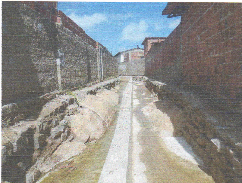
FIGURA 13 – SERVIÇO DE DEMOLIÇÃO E LIMPEZA – TRECHO ENTRE A RUA DELFINO DE OLIVEIRA E RUA BEVENUTO ALVES DA ROCHA;