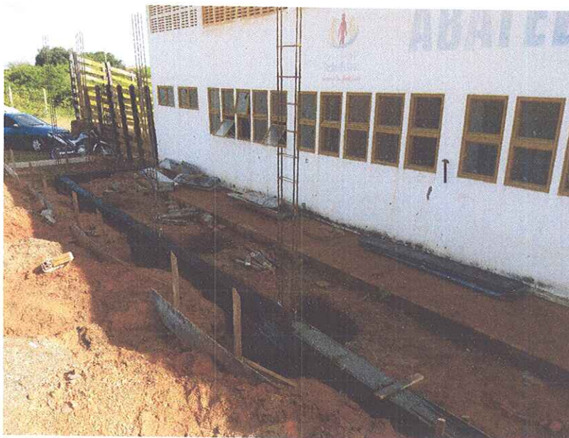
Figura 7 - EXECUÇÃO DE BALDREAMES E REATERRO DE VALAS;

OBJETO: ADEQUAÇÃO E AMPLIAÇÃO DO ABATEDOURO PÚBLICO ENDEREÇO DA OBRA: RUA ESTRADA VICINAL IDA PARA COMUNIDADE BAIXA DO ARROZ, RN 117, ZONA RURAL, RIACHO DA CRUZ – RN CONTRATO DE REPASSE Nº 1.044.418-49/2017 SICONV Nº 851098 RELATÓRIO FOTOGRÁFICO: PRIMEIRA MEDIÇÃO – PERÍODO 23.01.2020 A 24.04.2020