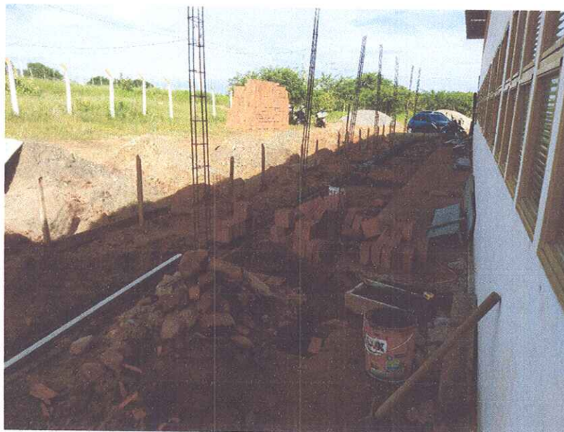
Figura 5 – EXECUÇÃO DE EMBASAMENTO PARA ALVENARIAS;

OBJETO: ADEQUAÇÃO E AMPLIAÇÃO DO ABATEDOURO PÚBLICO ENDEREÇO DA OBRA: RUA ESTRADA VICINAL IDA PARA COMUNIDADE BAIXA DO ARROZ, RN 117, ZONA RURAL, RIACHO DA CRUZ – RN CONTRATO DE REPASSE N° 1.044.418-49/2017 SICONV N° 851098 RELATÓRIO FOTOGRÁFICO: PRIMEIRA MEDIÇÃO – PERÍODO 23.01.2020 A 24.04.2020