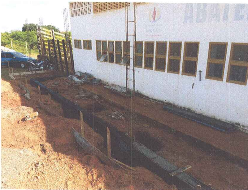
Figura 8 – IMPERMEABILIZAÇÃO DE FUNDAÇÃO E ESTRUTURAS.