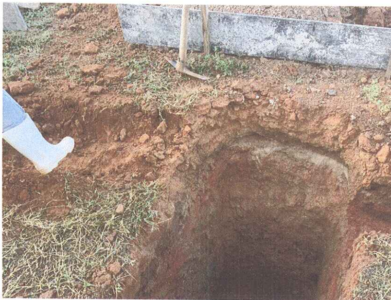
Figura 3 - ESCAVAÇÕES PARA EXECUÇÃO DE SAPATAS DE FUNDAÇÃO;

OBJETO: ADEQUAÇÃO E AMPLIAÇÃO DO ABATEDOURO PÚBLICO ENDEREÇO DA OBRA: RUA ESTRADA VICINAL IDA PARA COMUNIDADE BAIXA DO ARROZ, RN 117, ZONA RURAL, RIACHO DA CRUZ – RN CONTRATO DE REPASSE N° 1.044.418-49/2017 SICONV N° 851098 RELATÓRIO FOTOGRÁFICO: PRIMEIRA MEDIÇÃO – PERÍODO 23.01.2020 A 24.04.2020