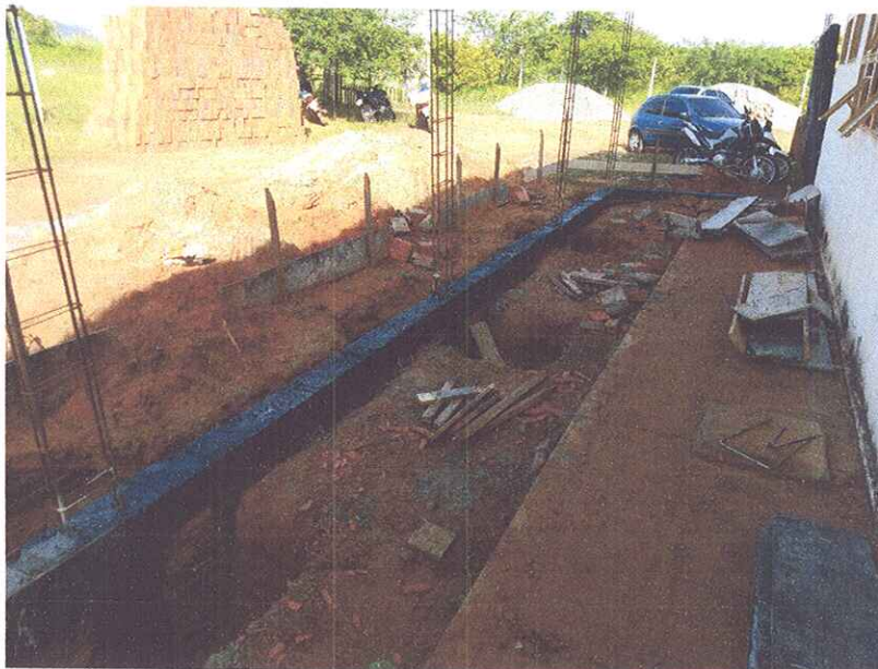
Figura 6 - EXECUÇÃO DE BALDREAMES E REATERRO DE VALAS;