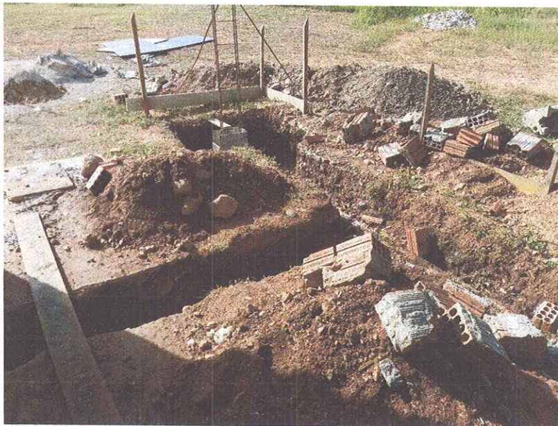
Figura 4 - ESCAVAÇÕES PARA EXECUÇÃO DE FUNDAÇÃO;