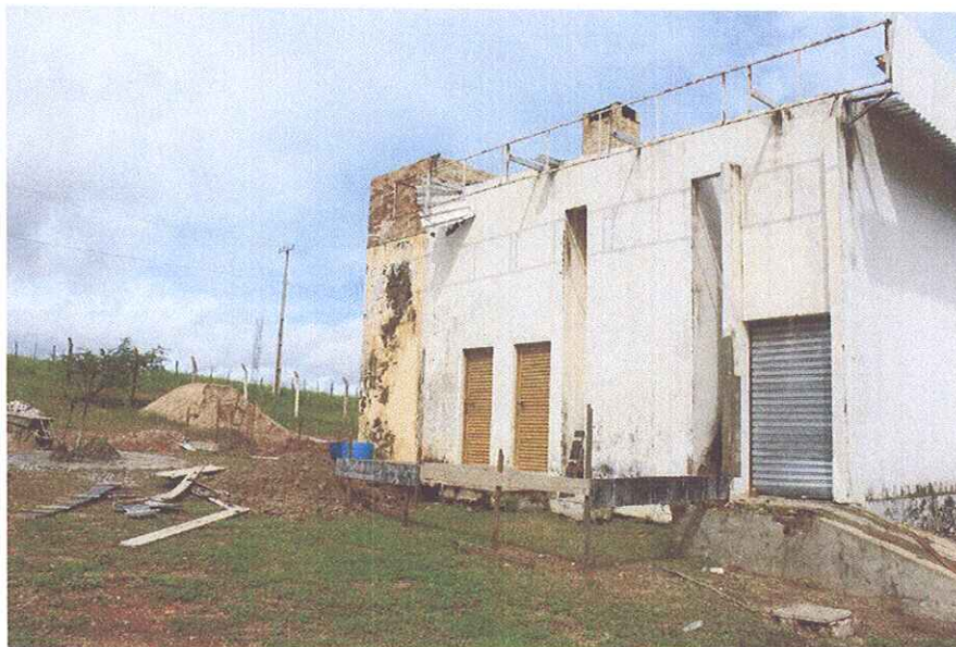
Figura 2 - EXECUÇÃO DE GABARITO PARA LOCAÇÃO DE OBRA;

Zilton Pedro Menezes Marin Zilton Pedro Menezes Marin Engenheiro Civil CREA/RN: 211554676-8