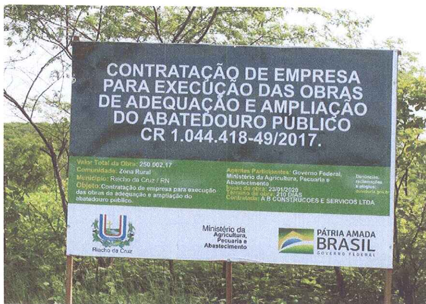
Figura 1 - PLACA DA OBRA EM CHAPA DE AÇO GALVANIZADO;

OBJETO: ADEQUAÇÃO E AMPLIAÇÃO DO ABATEDOURO PÚBLICO ENDEREÇO DA OBRA: RUA ESTRADA VICINAL IDA PARA COMUNIDADE BAIXA DO ARROZ, RN 117, ZONA RURAL, RIACHO DA CRUZ – RN CONTRATO DE REPASSE Nº 1.044.418-49/2017 SICONV Nº 851098 RELATÓRIO FOTOGRÁFICO: PRIMEIRA MEDIÇÃO – PERÍODO 23.01.2020 A 24.04.2020