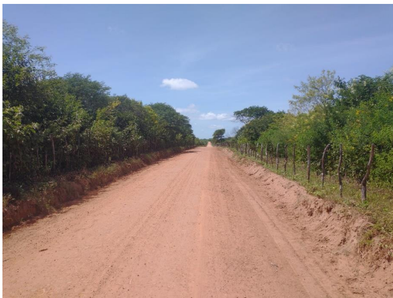
FIGURA 8 – EXECUÇÃO DE ESTRADAS VICINAIS NO MUNICÍPIO DE RIACHO DA CRUZ – RN - TRECHO NA COMUNIDADE SÃO PAULO/VOLTA;