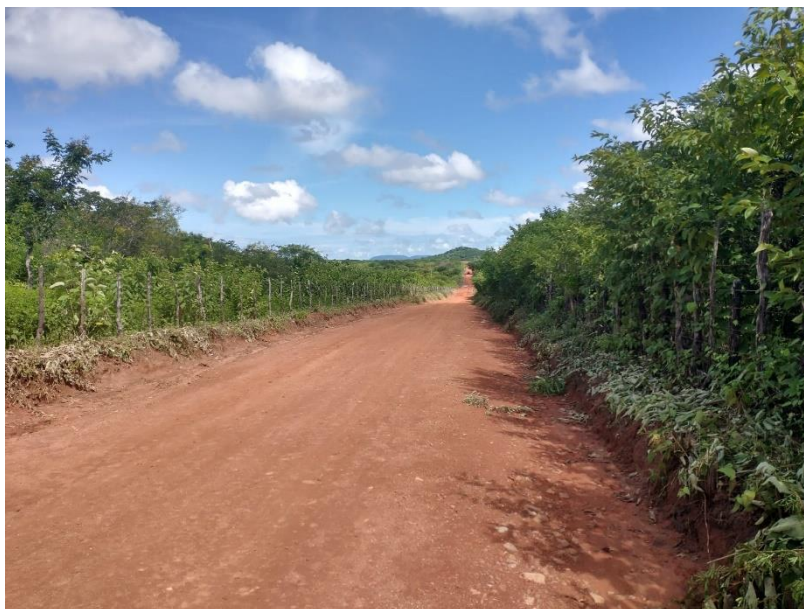
FIGURA 7 – EXECUÇÃO DE ESTRADAS VICINAIS NO MUNICÍPIO DE RIACHO DA CRUZ – RN - TRECHO NA COMUNIDADE SÃO PAULO/VOLTA;

RELATÓRIO FOTOGRÁFICO: QUARTA MEDIÇÃO – PERÍODO 23.11.2022 A 19.05.2023