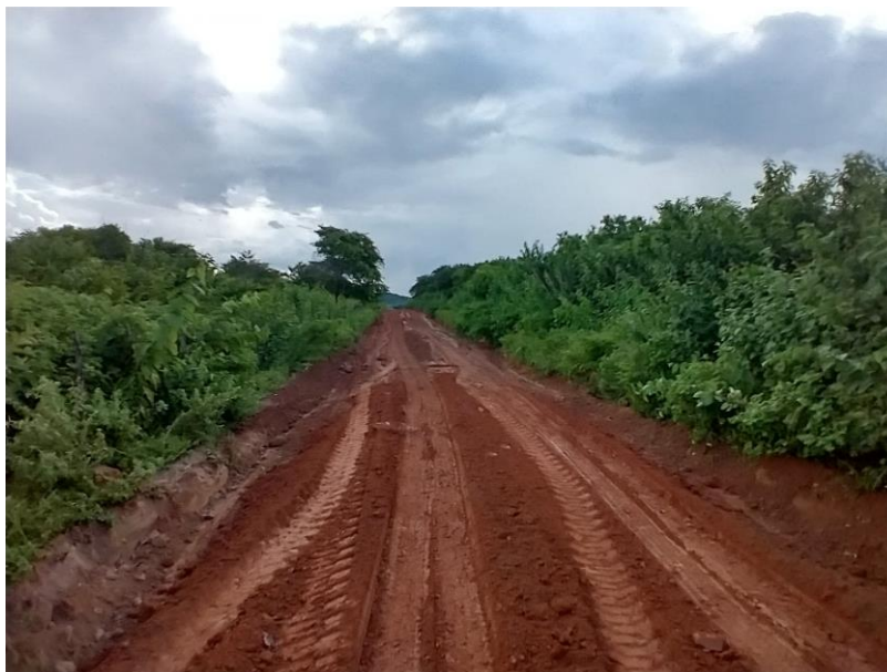
FIGURA 3 – EXECUÇÃO DE ESTRADAS VICINAIS NO MUNICÍPIO DE RIACHO DA CRUZ – RN - TRECHO NA COMUNIDADE SÃO PAULO/VOLTA;

RELATÓRIO FOTOGRÁFICO: QUARTA MEDIÇÃO – PERÍODO 23.11.2022 A 19.05.2023