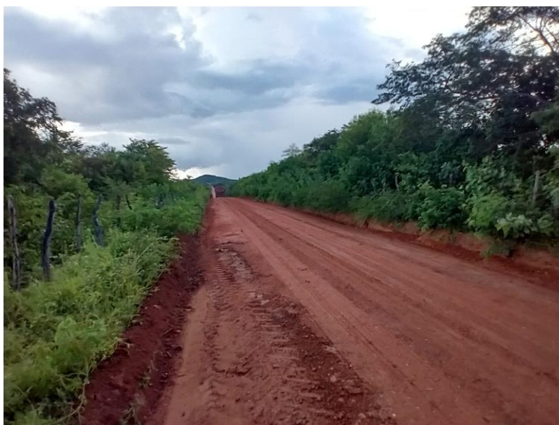
FIGURA 4 – EXECUÇÃO DE ESTRADAS VICINAIS NO MUNICÍPIO DE RIACHO DA CRUZ – RN - TRECHO NA COMUNIDADE SÃO PAULO/VOLTA;