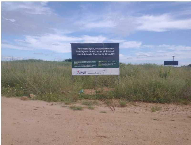
FIGURA 1 – PLACA DE IDENTIFICAÇÃO DA OBRA;

RELATÓRIO FOTOGRÁFICO: QUARTA MEDIÇÃO – PERÍODO 23.11.2022 A 19.05.2023