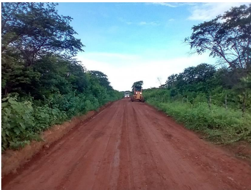
FIGURA 5 – EXECUÇÃO DE ESTRADAS VICINAIS NO MUNICÍPIO DE RIACHO DA CRUZ – RN - TRECHO NA COMUNIDADE SÃO PAULO/VOLTA;

RELATÓRIO FOTOGRÁFICO: QUARTA MEDIÇÃO – PERÍODO 23.11.2022 A 19.05.2023