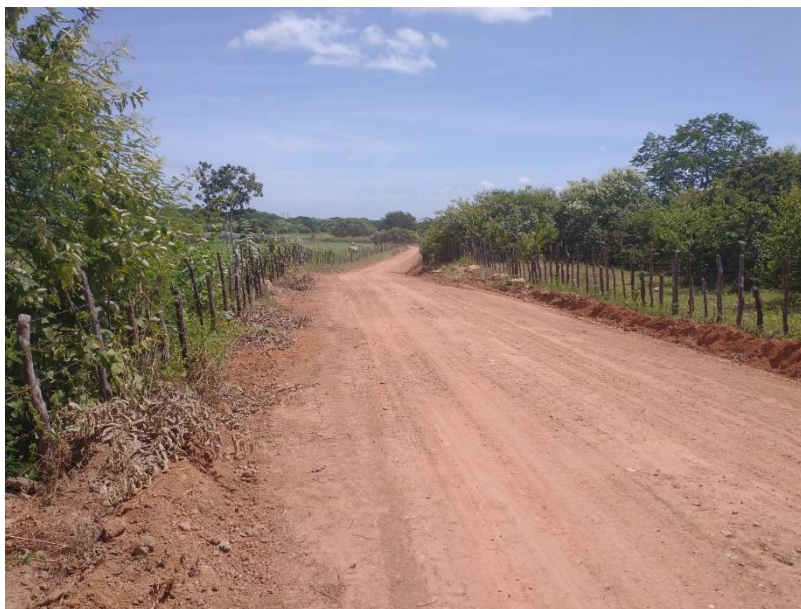
FIGURA 9 – EXECUÇÃO DE ESTRADAS VICINAIS NO MUNICÍPIO DE RIACHO DA CRUZ – RN - TRECHO NA COMUNIDADE SÃO PAULO/VOLTA;

RELATÓRIO FOTOGRÁFICO: QUARTA MEDIÇÃO – PERÍODO 23.11.2022 A 19.05.2023