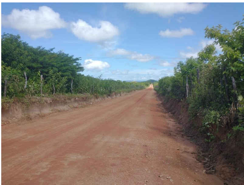
FIGURA 6 – EXECUÇÃO DE ESTRADAS VICINAIS NO MUNICÍPIO DE RIACHO DA CRUZ – RN - TRECHO NA COMUNIDADE SÃO PAULO/VOLTA;