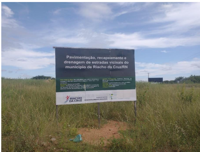
FIGURA 2 – PLACA DE IDENTIFICAÇÃO DA OBRA;