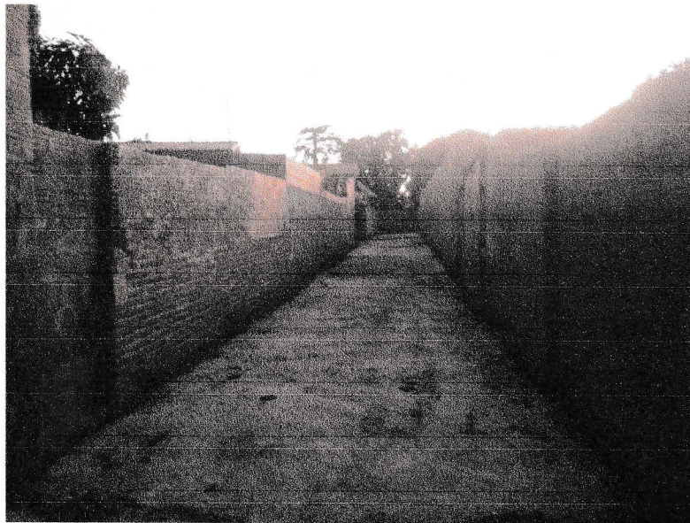
FIGURA 2 - CONCLUSÃO DA EXECUÇÃO DE CONCRETAGEM DE LAJE E VIGAMENTOS DO TRECHO ENTRE A RUA 15 DE NOVEMBRO E RUA 07 DE SETEMBRO;

Marcos Aurelio de Paiva Rêgo PREFEITO MUNICIPAL CPF: 503.344.094-70