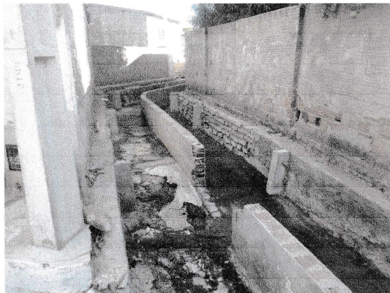
FIGURA 8 - EXECUÇÃO DE CONCRETAGEM DE PILARETES DO TRECHO ENTRE A RUA 07 DE SETEMBRO E A RUA DELFINO FRANCISCO;