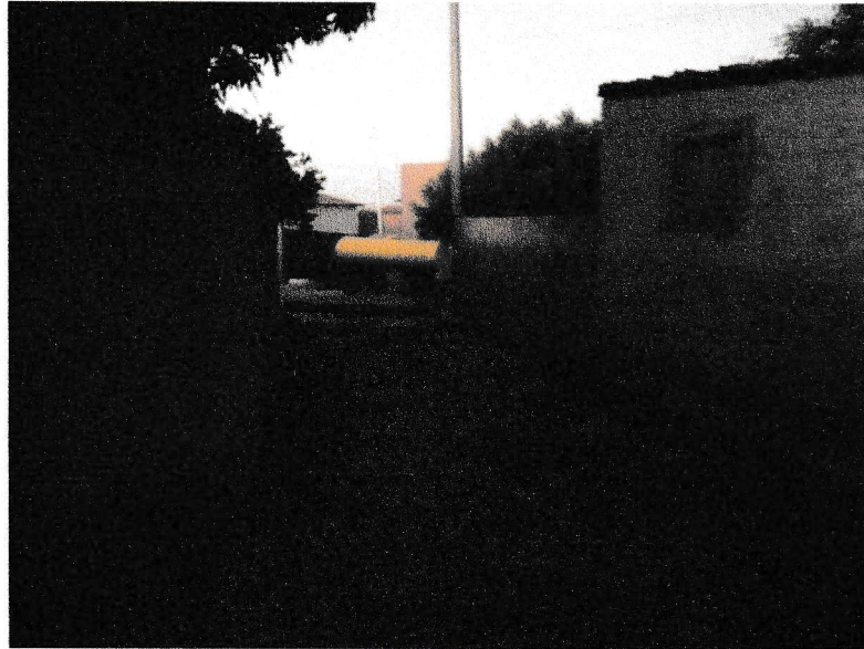
FIGURA 9 – EXECUÇÃO DE CONCRETAGEM DE LAJE E VIGAMENTOS DO TRECHO ENTRE A RUA 07 DE SETEMBRO E A RUA DELFINO FRANCISCO;