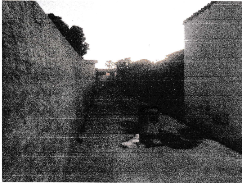
FIGURA 1 – CONCLUSÃO DA EXECUÇÃO DE CONCRETAGEM DE LAJE E VIGAMENTOS DO TRECHO ENTRE A RUA 15 DE NOVEMBRO E RUA 07 DE SETEMBRO;