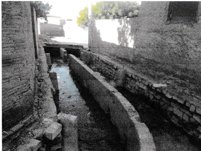
FIGURA 5 – EXECUÇÃO DE CONCRETAGEM DE PILARETES DO TRECHO ENTRE A RUA 07 DE SETEMBRO E A RUA DELFINO FRANCISCO;