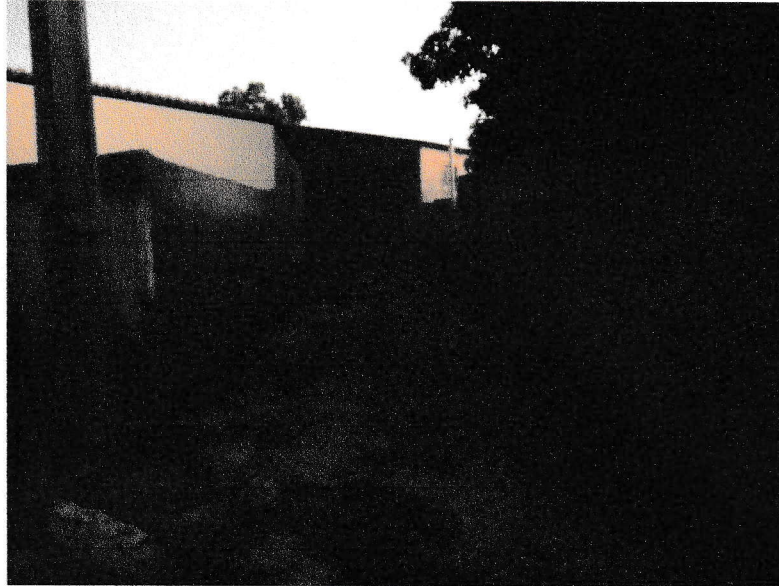
FIGURA 11 – EXECUÇÃO DE CONCRETAGEM DE LAJE E VIGAMENTOS DO TRECHO ENTRE A RUA 07 DE SETEMBRO E A RUA DELFINO FRANCISCO;