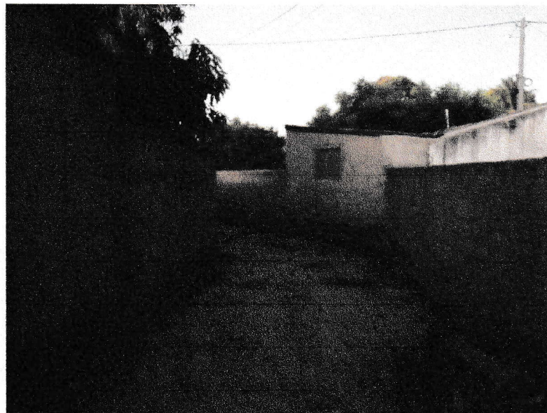
FIGURA 10 - EXECUÇÃO DE CONCRETAGEM DE LAJE E VIGAMENTOS DO TRECHO ENTRE A RUA 07 DE SETEMBRO E A RUA DELFINO FRANCISCO;

Handwritten signature of Marcos Aurelio de Paiva Rêgo MARCOS AURELIO DE PAIVA RÊGO PREFEITO MUNICIPAL CPF: 503.344.000-20