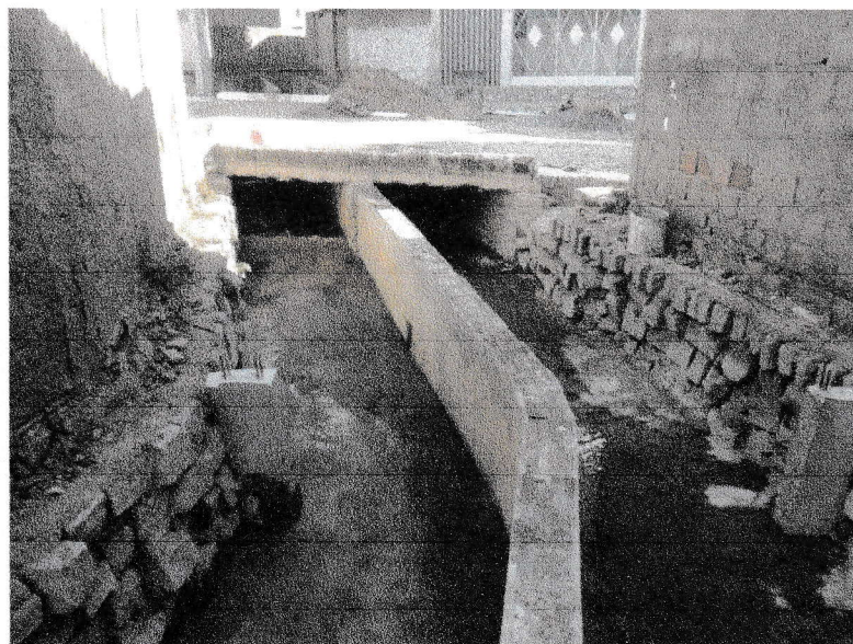
FIGURA 4 – EXECUÇÃO DE CONCRETAGEM DE PILARETES DO TRECHO ENTRE A RUA 07 DE SETEMBRO E A RUA DELFINO FRANCISCO;

Mareos Aureo de Paiva Rêgo PREFEITO MUNICIPAL CPF: 503.344.094-20