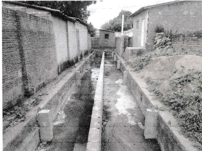
FIGURA 7 – EXECUÇÃO DE CHAPISCO, REVESTIMENTO ARGAMASSADO E CONTRAPISO DO TRECHO ENTRE A RUA 07 DE SETEMBRO E A RUA DELFINO FRANCISCO;