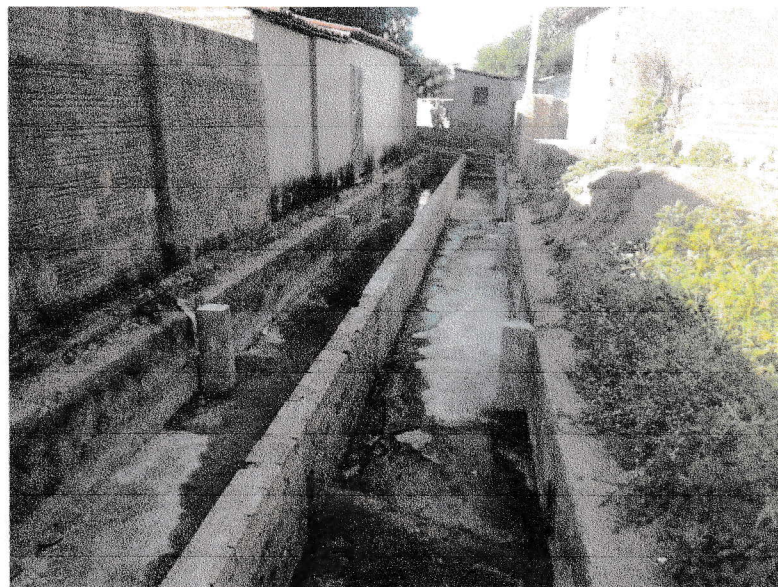
FIGURA 6 - EXECUÇÃO DE CHAPISCO, REVESTIMENTO ARGAMASSADO E CONTRAPISO DO TRECHO ENTRE A RUA 07 DE SETEMBRO E A RUA DELFINO FRANCISCO;

Marcos Aurélio de Paiva Rêgo PREFEITO MUNICIPAL CPF: 503.344.094-20