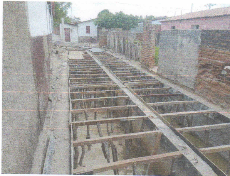
FIGURA 8 - EXECUÇÃO DE FORMAS E ESCORAMENTOS PARA LAJE DO TRECHO ENTRE A RUA 15 DE NOVEMBRO E RUA 07 DE SETEMBRO;

Marcos Aurelio de Paula Rego PREFEITO MUNICIPAL CPF: 503.344.094-70