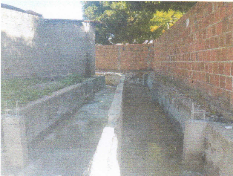
FIGURA 6 - EXECUÇÃO DE CHAPISCO, REVESTIMENTO ARGAMASSADO E CONTRAPISO DO TRECHO ENTRE A RUA 15 DE NOVEMBRO E RUA 07 DE SETEMBRO;