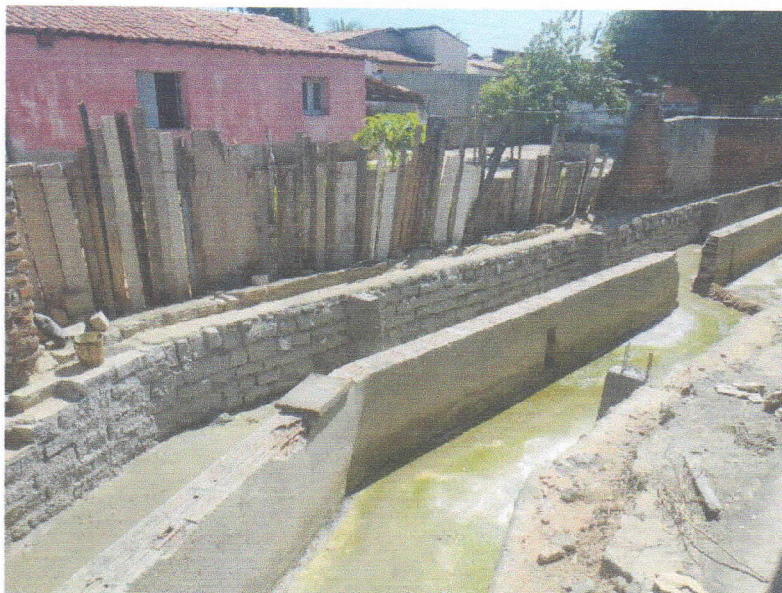
FIGURA 4 – EXECUÇÃO DE CHAPISCO, REVESTIMENTO ARGAMASSADO DO TRECHO ENTRE A RUA 15 DE NOVEMBRO E RUA 07 DE SETEMBRO;