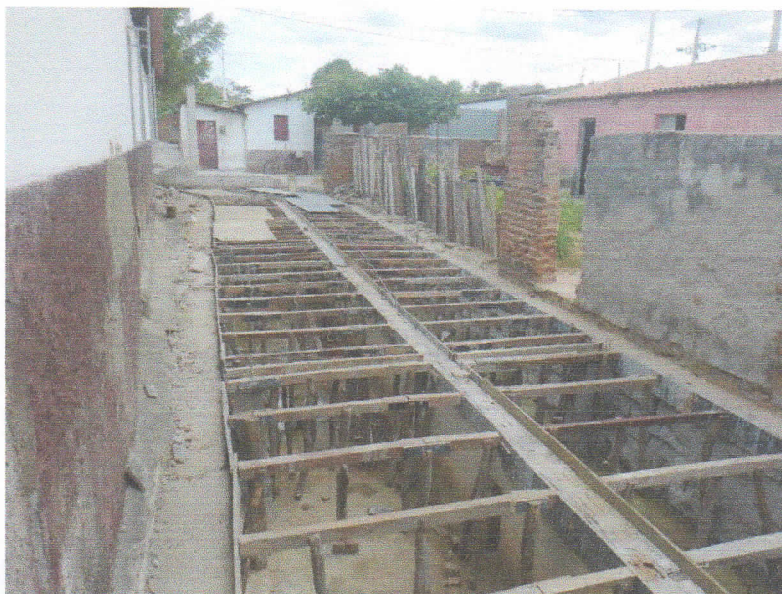
FIGURA 9 – EXECUÇÃO DE FORMAS E ESCORAMENTOS PARA LAJE DO TRECHO ENTRE A RUA 15 DE NOVEMBRO E RUA 07 DE SETEMBRO;