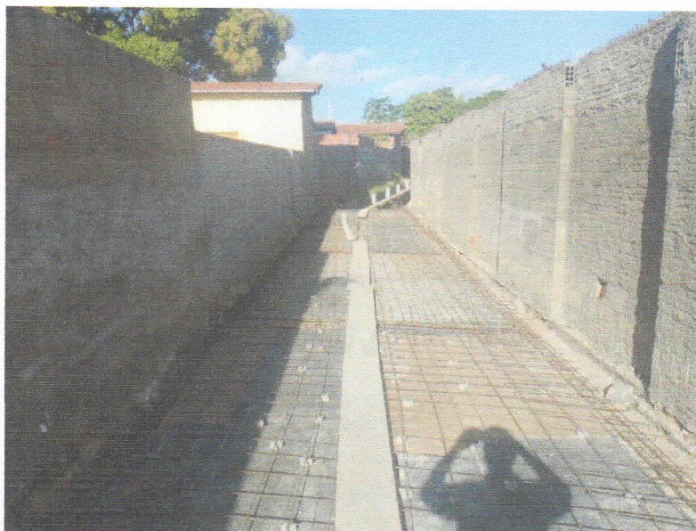
FIGURA 11 – EXECUÇÃO DE FORMAS E ARMAÇÃO DE LAJE DO TRECHO ENTRE A RUA 15 DE NOVEMBRO E RUA 07 DE SETEMBRO;