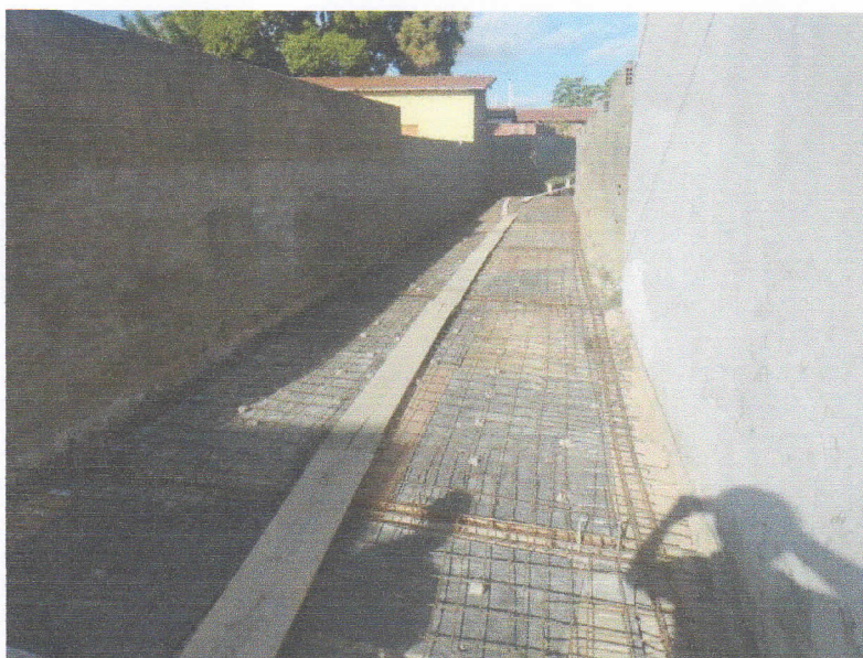
FIGURA 10 - EXECUÇÃO DE FORMAS E ARMAÇÃO DE LAJE DO TRECHO ENTRE A RUA 15 DE NOVEMBRO E RUA 07 DE SETEMBRO;

Marcos Aurélio de Paiva Rêgo PREFEITO MUNICIPAL CPF 503.344.094-20