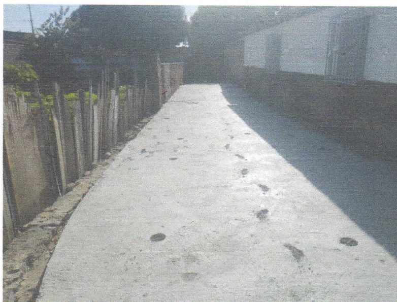
FIGURA 12 – EXECUÇÃO DE CONCRETAGEM DE LAJE E VIGAMENTOS DO TRECHO ENTRE A RUA 15 DE NOVEMBRO E RUA 07 DE SETEMBRO;