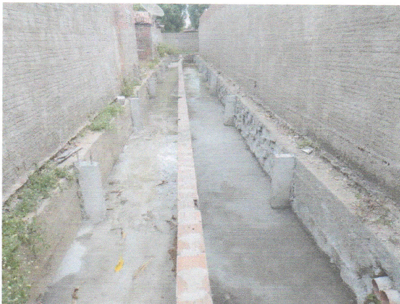
FIGURA 5 – EXECUÇÃO DE CHAPISCO, REVESTIMENTO ARGAMASSADO E CONTRAPISO DO TRECHO ENTRE A RUA 15 DE NOVEMBRO E RUA 07 DE SETEMBRO;