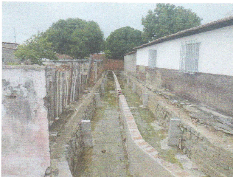
FIGURA 3 – EXECUÇÃO DE CONCRETAGEM DE PILARETES DO TRECHO ENTRE A RUA 15 DE NOVEMBRO E RUA 07 DE SETEMBRO;