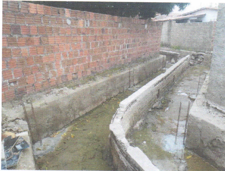
FIGURA 1 – EXECUÇÃO DE CONCRETAGEM DE FUNDAÇÕES DE PILARETES DO TRECHO ENTRE A RUA 15 DE NOVEMBRO E RUA 07 DE SETEMBRO;