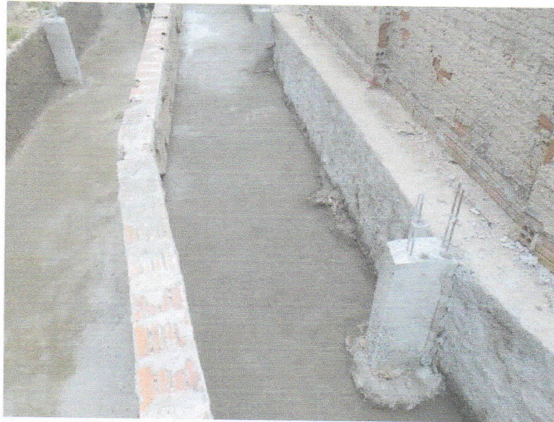
FIGURA 7 – EXECUÇÃO DE CHAPISCO, REVESTIMENTO ARGAMASSADO E CONTRAPISO DO TRECHO ENTRE A RUA 15 DE NOVEMBRO E RUA 07 DE SETEMBRO;