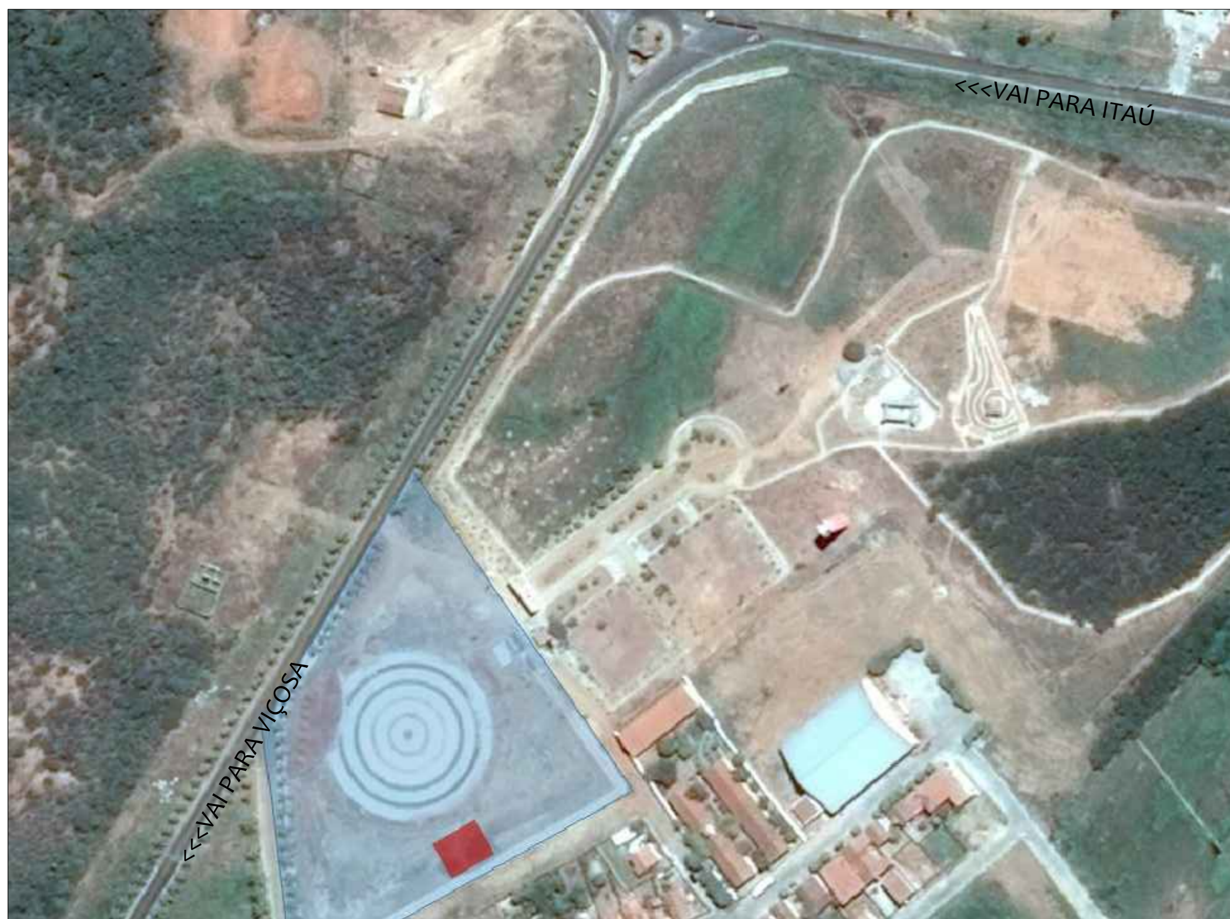
PLANTA DE SITUAÇÃO ESQUEMÁTICA Projeto para construção de um palco - Riacho da Cruz/RN Sem escala

■ PRAÇA DE EVENTOS ■ ÁREA DE IMPLANTAÇÃO DO PALCO