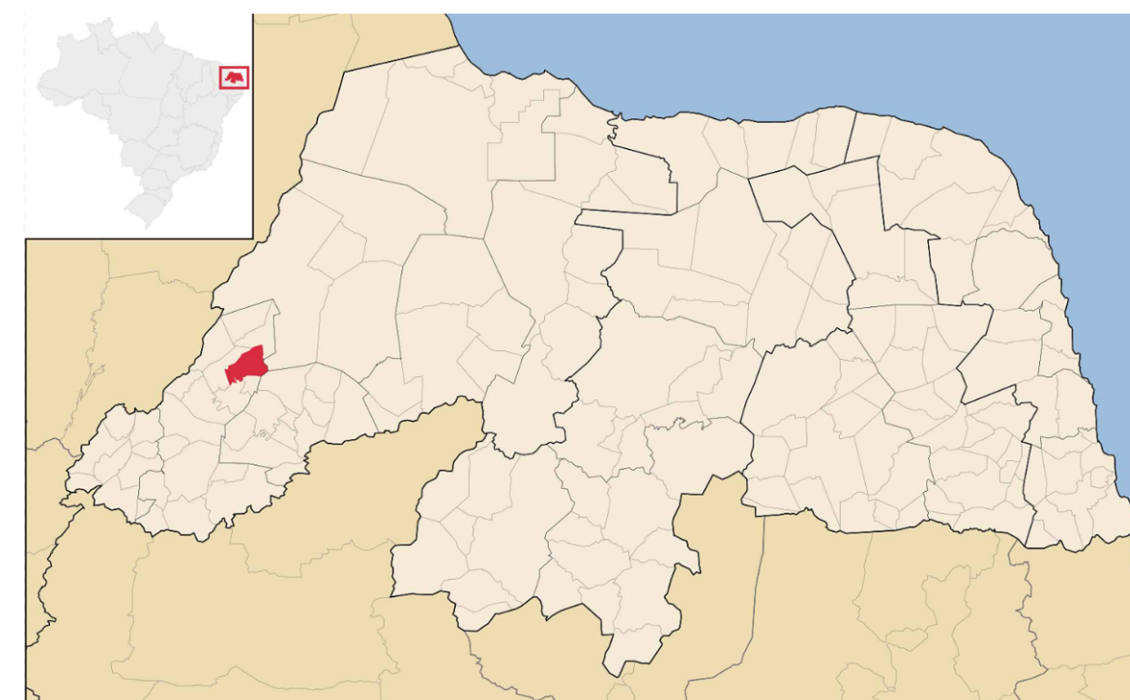
LOCALIZAÇÃO DO MUNICÍPIO NO MAPA ESTADUAL SEM ESCALA